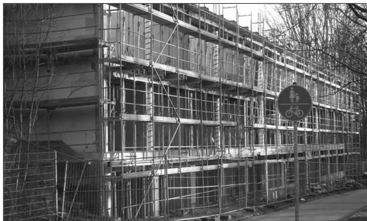
Ausschließlich mit städtischen Haushaltsmitteln errichtet: der Erweiterungsbau für THG und Hölty-Schule.