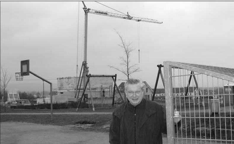
Freizeitsport wird in Elliehausen groß geschrieben, auf diesem Platz nahe dem Neubaugebiet kann auch Boule gespielt werden.

Fritz-Wilhelm Neumann: Alltag in der Dorfgemeinschaft