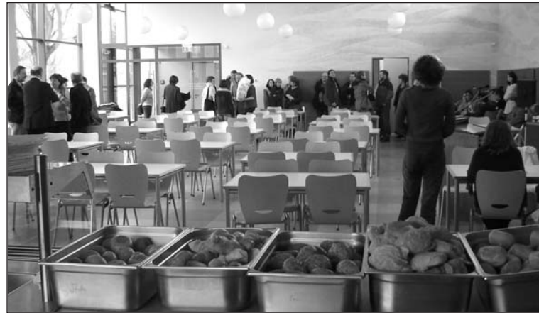
In der neuen Mensa der Personn-Realschule Weende können 120 Schülerinnen und Schüler gleichzeitig versorgt werden.