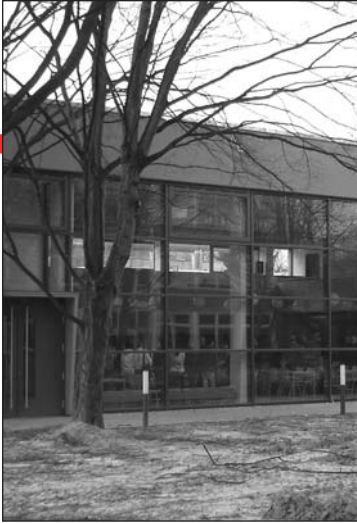
Auf dem Gelände des ehemaligen Lehrschwimmbeckens entstand die Mensa.

In einer kleinen Feierstunde mit kurzen Reden, musikalischen Einlagen und Theaterdarbietungen der Schülerinnen und Schüler hat die Stadt Göttingen die neue Mensa der Personn-Realschule in Weende eingeweiht.