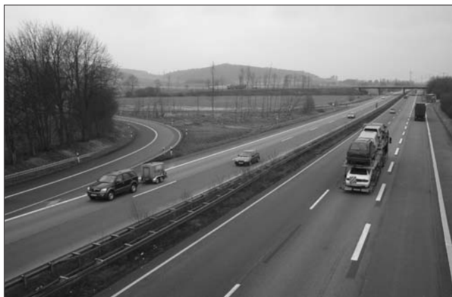
Dieses Bild von der Autobahn und dem Autobahnanschluss Göttingen-Nord hat Fritz-Wilhelm Neumann aufgenommen, um auf den notwendigen Schallschutz aufmerksam zu machen.

Die bessere Vermarktung und die Überwindung alter Planungsfehler des Elliehäuser Baugebietes, die Pflege der vitalen Vereinsgemeinschaft in den beiden Ortsteilen und den Erhalt der Infrastruktur mit Schule, Kitas, Handwerksbetrieben, Gärtnereien und Ge-